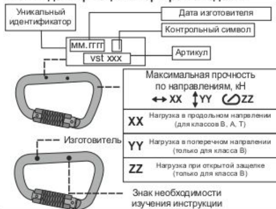
Рис. 1. Идентификация и маркировка изделия

Перед использованием данного снаряжения Вы обязаны: - Прочитать и понять инструкцию по эксплуатации. - Пройти тренировку по его применению под руководством квалифицированного инструктора. - Познакомиться с потенциальными возможностями и ограничениями по его применению. - Осознать и принять вероятность возникновения рисков, связанных с применением снаряжения. Игнорирование этих предупреждений может привести к серьезным травмам или даже смерти.